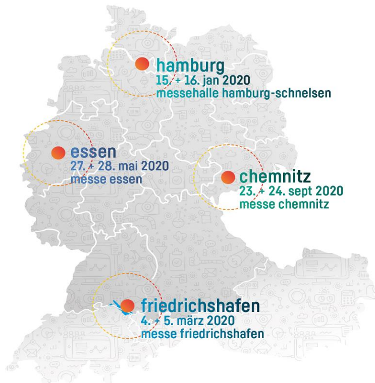
all about automation Termine und Orte 2020