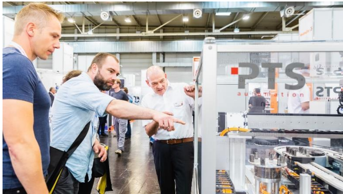
Interessiertes Messepublikum auf der all about automation

Weitere Informationen sind auf www.allaboutautomation.de verfügbar.